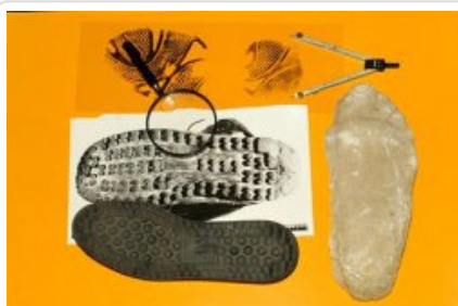
Traseologia zdjęcie numer 1

telefon miejski +48 4787 146 43, +48 4787 138 96