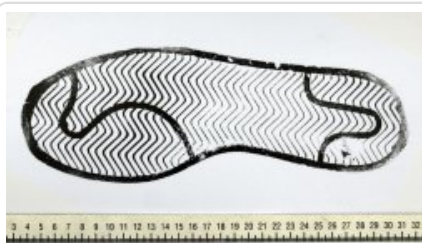
Traseologia zdjęcie numer 4