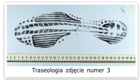
Traseologia zdjęcie numer 3