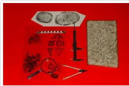
Traseologia zdjęcie numer 2