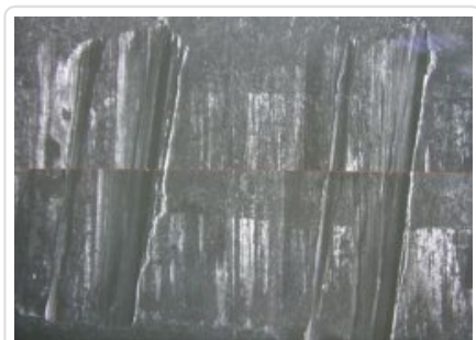
zestawienie cech wspólnych