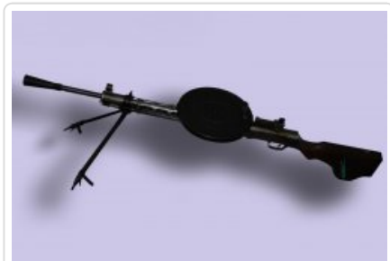
rkm DP wz. 1928 kal. 7,62 mm produkcji radzieckiej

telefon resortowy 87 132 71 telefon miejski +48 47 87 132 71