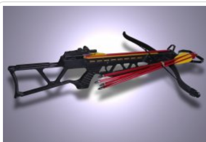
kusza wraz z bełtami