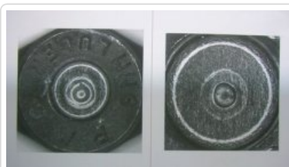
ślady mechanizmów broni odwzorowane na dnie łuski oraz miseczce spłonki od odstrzelonego naboju pistoletowego kal. 9 mm Luger (Parabellum)