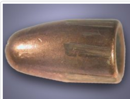
pocisk ze śladami wystrzelenia porównywanych śladów przewodu lufy broni palnej